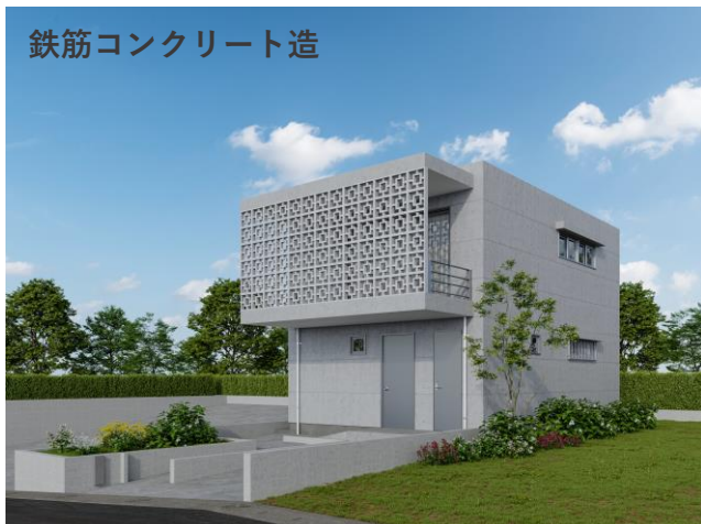
鉄筋コンクリート造